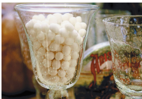
L'Anis de Flavigny