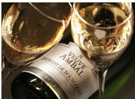
Le crémant de Bourgogne de la Veuve Ambal

Adhérent. L'absente de l'association est la Saône-et-Loire où un seul adhérent y figure, Euro Dispal à Allériot.