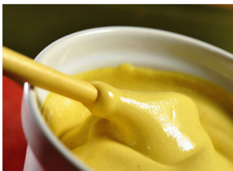
La moutarde Fallot.