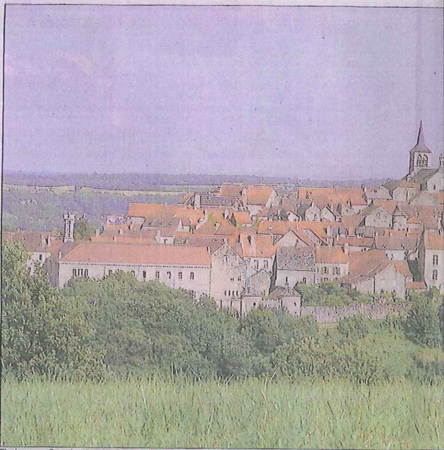
Flavigny-sur-Ozerain, classé parmi les plus beaux villages de France, a toujours été une terre de passage.