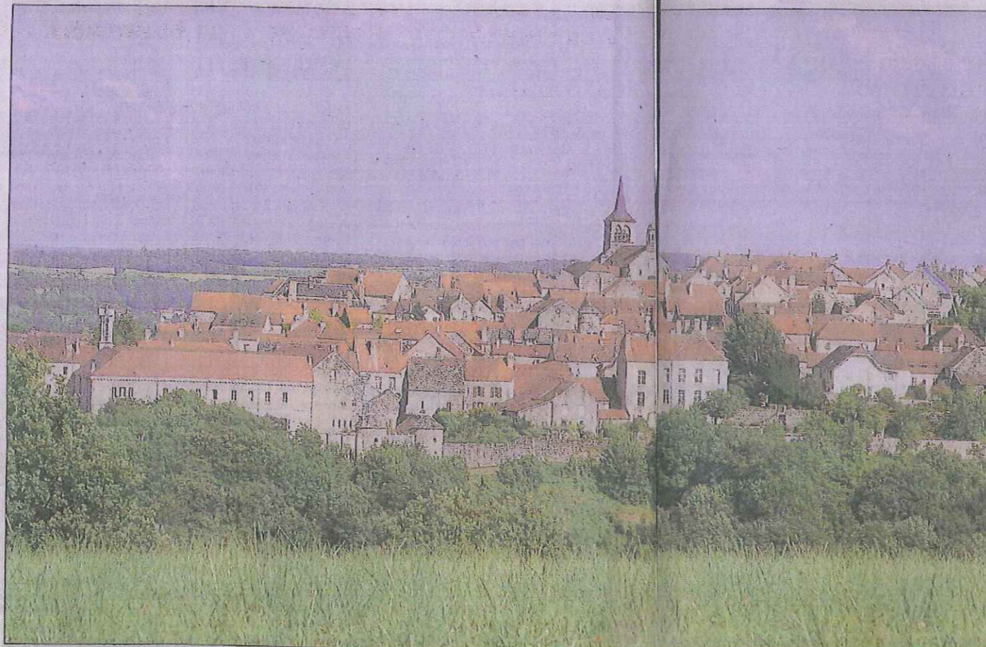
Flavigny-sur-Ozerain, classé parmi les plus beaux villages de France, a toujours été une terre de passage.