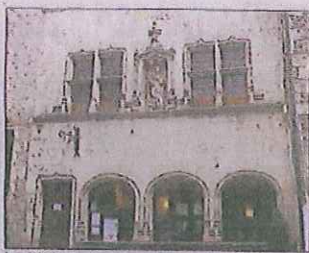
La Maison au Donataire sert d'office de tourisme.

La Société des amis de la cité de Flavigny (SACF) - fondée en 1956 - a été la première association de défense du patrimoine créée en France. Ces pionniers sont aujourd'hui 180 membres qui se consacrent à plusieurs missions. Ce sont d'abord la sauvegarde et la mise en valeur du village, avec un souci de repérage des édifices significatifs, mais aussi la publication de plaquettes, l'organisation de visites guidées, d'expositions et de conférences données par des universitaires. La SACF assure un accueil permanent à la Maison au Donataire, de Pâques à la Saint-Simon. Deux personnes bilingues renseignent les visiteurs. Le premier étage