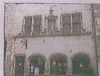
La Maison au Donataire sert d'office de tourisme.

La Société des amis de la cité de Flavigny (SACF) - fondée en 1956 - a été la première association de défense du patrimoine créée en France. Ces pionniers sont aujourd'hui 180 membres qui se consacrent à plusieurs missions. Ce sont d'abord la sauvegarde et la mise en valeur du village, avec un souci de repérage des édifices significatifs, mais aussi la publication de plaquettes, l'organisation de visites guidées, d'expositions et de conférences données par des universitaires. La SACF assure un accueil permanent à la Maison au Donataire, de Pâques à la Saint-Simon. Deux personnes bilingues renseignent les visiteurs. Le premier étage